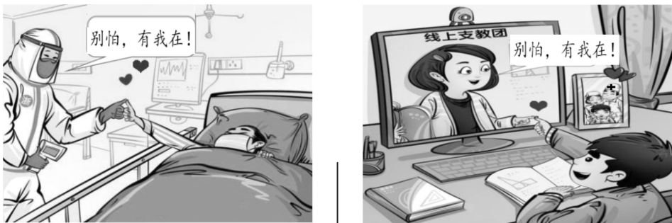
图 2 2020 年绍兴卷第 21 题

引导学生关注百姓生活常态，培养家国情怀。典型的如 2020 年绍兴卷第 21 题（如图 2），采用学生喜闻乐见的漫画题型，以“抗疫”为背景，以“传递”为主题，考查社会主义核心价值观、共担责任、践行优秀传统美德等学习内容，素养立意的价值导向鲜明。